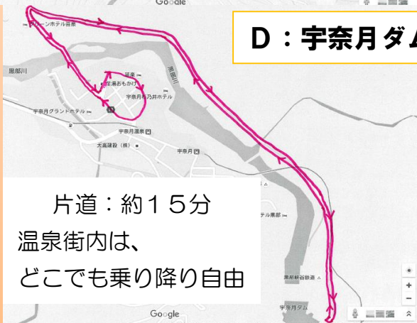
D：宇奈月ダム【大夢来館】(足湯おもかけ起点)