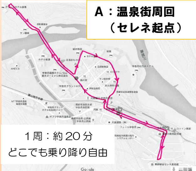
A：温泉街周回 (セレネ起点)