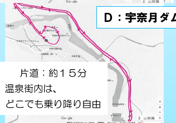
D：宇奈月ダム【大夢来館】(足湯おもかけ起点)